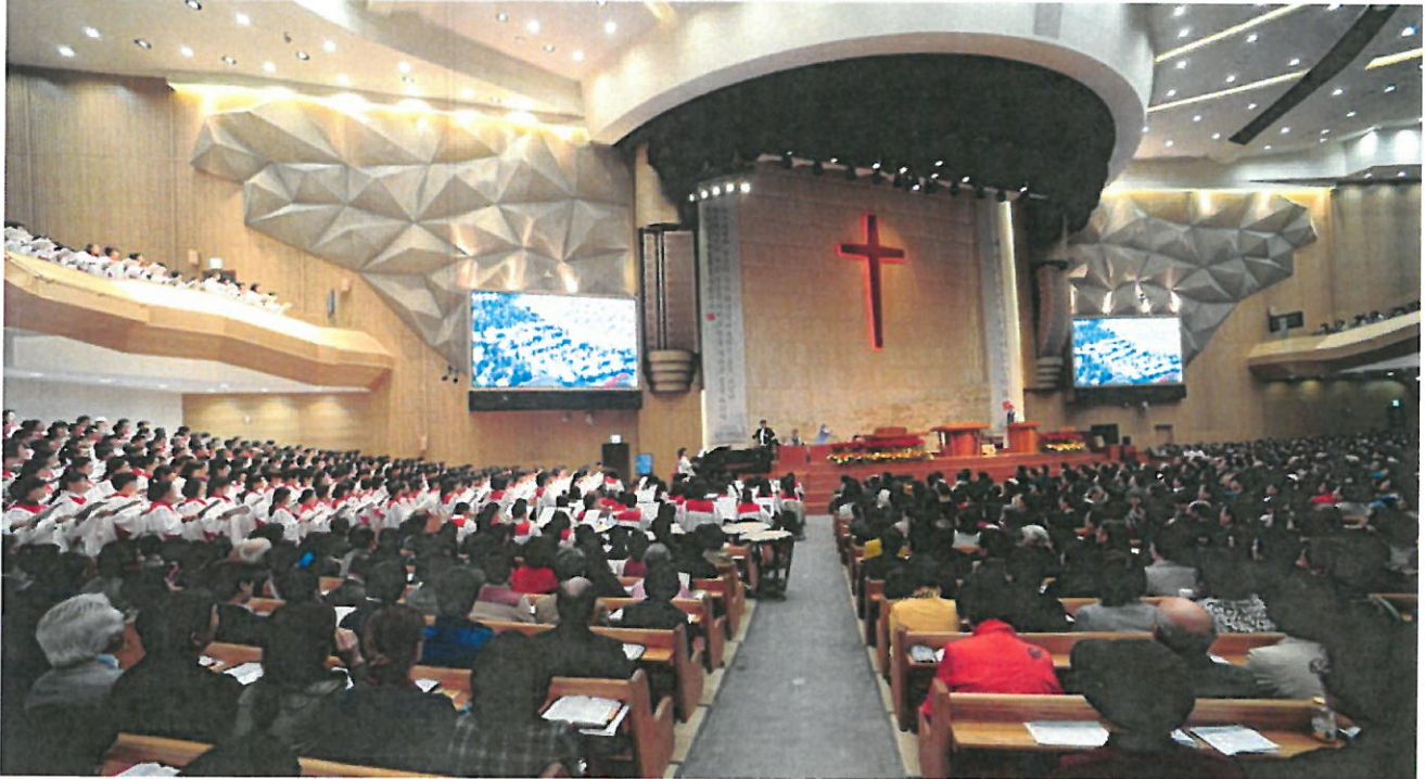
Generalforsamling i Kirkernes Verdensråd 2013 i Sydkorea. Her drøftes dokumentet "The Church: Towards a Common Vision.

I århundreder har kirkens plads som en naturlig del af samfundslivet i Danmark været uantastet – og Grundloven i 1849 understregede folkekirkens position som en af samfundets grundpiller. I disse år udfordres folkekirken imidlertid af sekularisering og multireligiøsitet, medlemstallet falder støt og nye religioner udfordrer folkekirken – og andre kristne trossamfund. Samtidig lever vi en tid, hvor der eksperimenteres med gudstjenesteformer, kirkelige aktiviteter, menighedsmodeller og organisationsformer. I den situation er der al mulig grund til at besinde sig på, hvad det vil sige at være kirke.