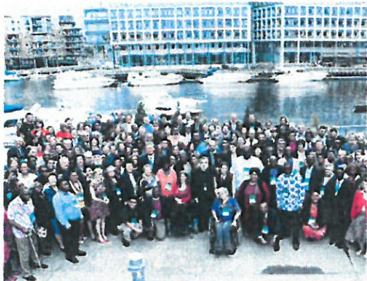
SAMLET: De 150 medlemmene i Kirkenes Verdensråds sentralkomité har vært samlet i Trondheim den siste uken.