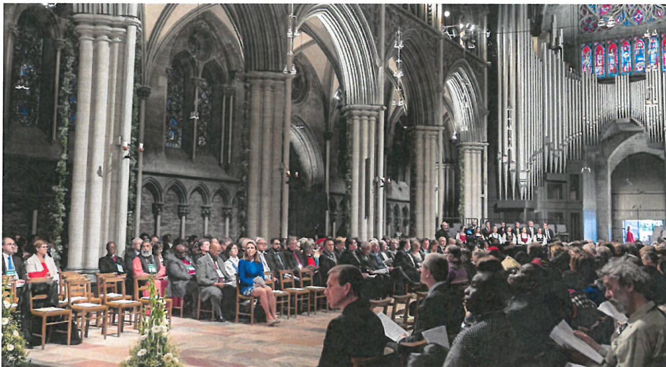
Økumenisk gudstjeneste i Nidaros Domkirke ved Centralkomitémødet den 22.-28. juni 2016.